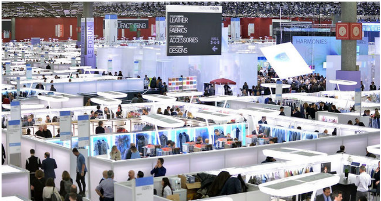
Première Vision Paris

Le rendez-vous parisien de Première Vision réunira 1 954 sociétés exposantes (+3 %) du 19 au 21 septembre au Parc des Expositions de Villepinte, pour une édition marquant plusieurs évolutions, sur le fond comme sur la forme.