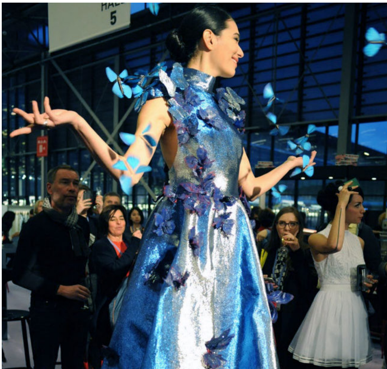
Première Vision Paris

accessoires et composants pour la mode et le design PV Accessories. Sur les six salons, l'offre sera une nouvelle fois très majoritairement italienne (657 exposants). Arriveront ensuite les sociétés françaises (265), turques (166), britanniques (144) et espagnoles (90).